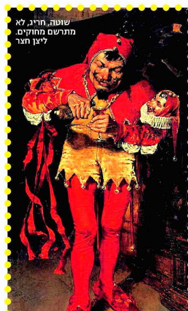
שוטה, חריג, לא מתורשם מחזקים. ליצן חצר

"ילד שמגלה פחד מליצן, אסור להכריח אותו להשתתף באירוע, ובטח לא נשאר אותו שם בכוח",