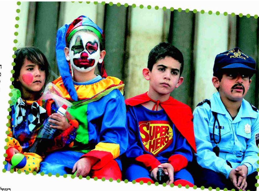
לא מחזיק אותם. ילדים במסיבת פורים

לפני כשנתיים החליטו רשויות העיר סרסוטה בארה"ב לקשט את הרחובות בפסלי ליצנים מפברגלאס, שנצבעו ועוטרו על ידי תושבי המקום. עוד לפני שהוצב המיצג, הוצפה העירייה במבול של קריאות טלפוניות, אימיילים, מכתבים ואפילו הפגנות נגד הפסלים. בשל ממדי המחאה החליטו הרשויות להקטין את מספר הליצנים ואת משך הצגתם