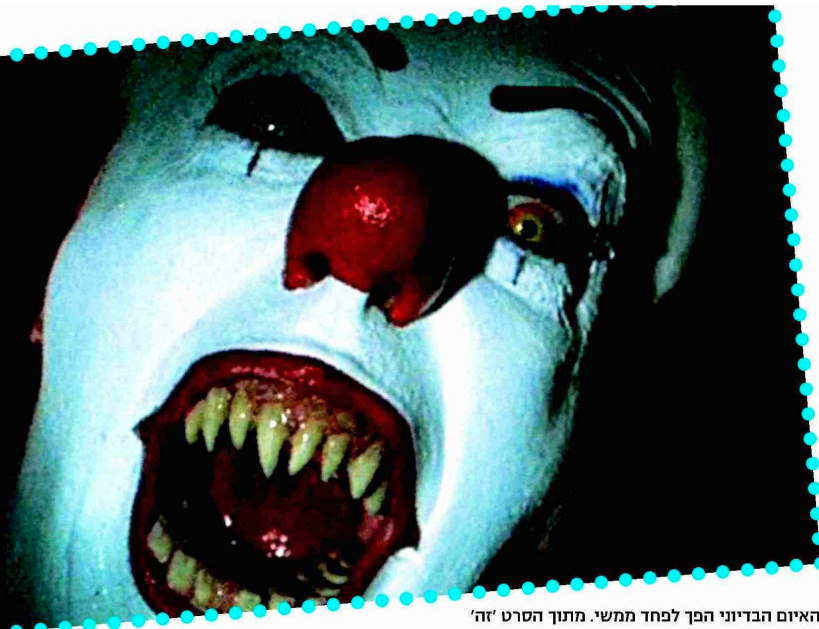
האיום הבדיוני הפך לפחד ממשי. מתוך הסרט 'זה'

הולדת (למרות שזה גם די מאיים). אני מתכוונת לליצנים המפחידים האלה, כמו בפרקים של 'על טבעי' (סדרת טלוויזיה) ובאלה' (בלוג של תוכנית טלוויזיה ישראלית בנטע 10)